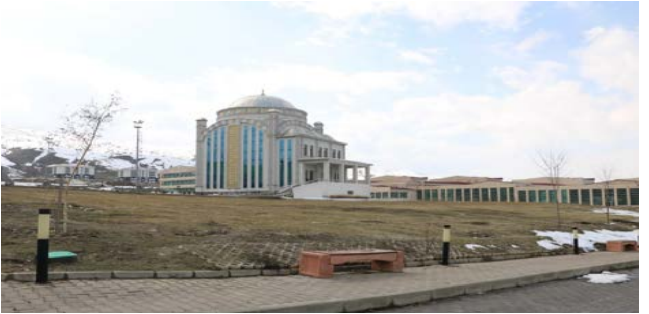
Resim 5 Gazze Camii

Muş Alparslan Üniversitesi Kalkındırma Vakfı tarafından yapımı üstlenilen Gazze Camii'sinin inşaat çalışmaları devam etmektedir.