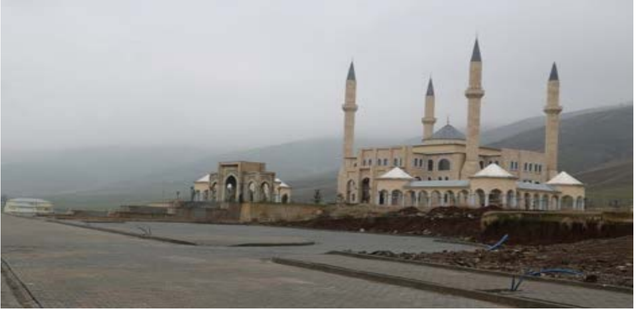
Resim 4 Sultan Muhammed Alparslan Camii

Türkiye Diyanet Vakfı tarafından yapımı üstlenilen Sultan Muhammed Alparslan Camii'sinin peyzaj çalışmaları devam etmektedir.