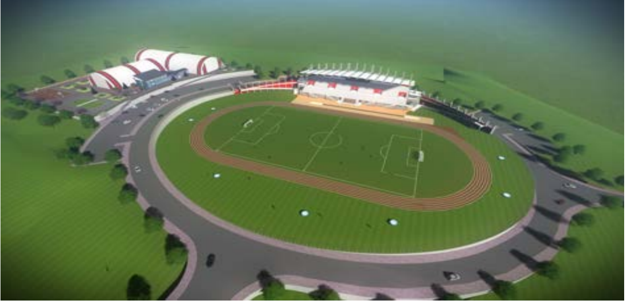
Resim 3 Açık Spor Tesisleri

%36'sı tamamlanmıştır. "Açık ve Kapalı Spor Tesisleri" 31.08.2022 tarih ve 60804 sayılı rektörlük oluru ile fesih edilmiştir.