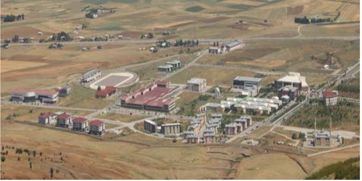
Resim 1 Merkez Külliye Alanı